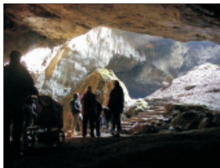
DIE BLAUE GROTTE