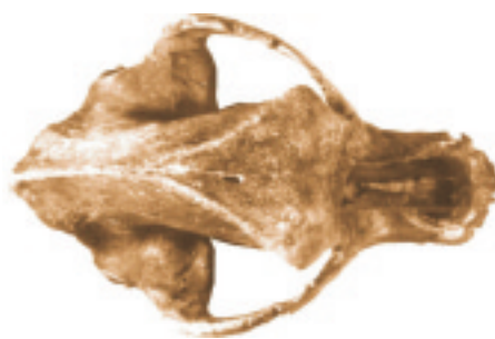
SCHÄDEL DES HÖHLENBÄREN Ursus spelaeus

Um dies alles einer breiten Öffentlichkeit nahe zu bringen, wurde 2002 der gemeinnützige Verein „Gesellschaft Unicornu fossile e.V.“ gegründet. An den GeoPark Harz-Braunschweiger Land-Ostfalen angeschlossen, hat er das Hauptziel der geotouristischen Neuerschließung des Besucherbetriebes, speziell auch für Schulklassen. Daneben soll mittelfristig die weitere Erforschung der Höhle vorangetrieben werden.